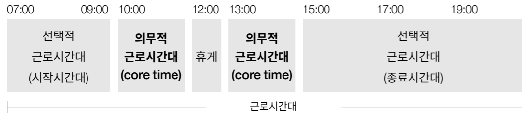
그림2 부분선택적 근로시간제 예시

부분선택적 근로시간제의 경우 의무근로시간대를 너무 길게 설정하면, 근로자의 선택의 폭이 없어져버리기 때문에 선택적 근로시간제로 볼 수 없게 됩니다. 또한 선택적 근로시간제를 시행한다 하더라도 야간근로나 휴일근로에 대해서는 가산수당을 지급해야 하므로, 일부 회사에서는 22시부터 06시까지를 금지근로시간대로 설정하기도 합니다.