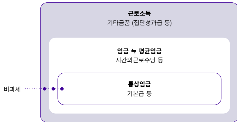
그림1 임금 등 근로소득과 비과세 금품

4대보험산정기준인 소득 = [기본급(월200만원) + 상여금(월 40만원) + 시간외수당(고정 월50만원) + 기타수당(직책수당 월 15만원) + 식대(월10만원) + 보육수당(월10만원) + 연구수당(월20만원)] - [식대(월10만원)+보육수당(월10만원)+연구수당(월20만원)]